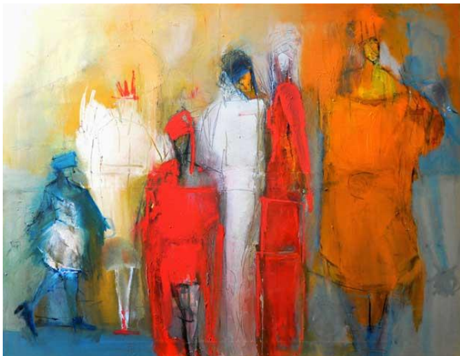
Molly meets magic